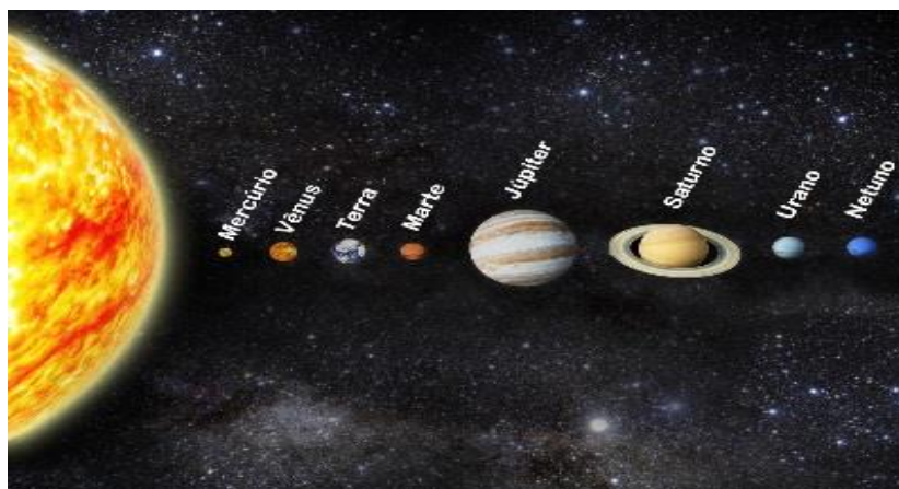
Os nomes e a ordem dos planetas que formam o Sistema Solar

O Sistema Solar é um conjunto de planetas, cometas, planetas-anões, asteroides e outros corpos celestes que orbitam em torno do Sol, que é uma estrela. Além da Terra, os outros sete planetas que fazem parte desse sistema são: Mercúrio, Vênus, Marte, Júpiter, Saturno, Urano e Netuno. Observe a figura abaixo: