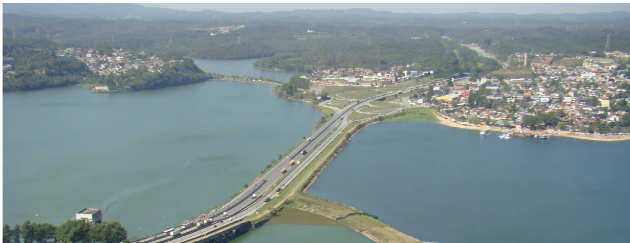
Figura 1 - Trecho do reservatório Billings próximo à rodovia Anchieta, onde se observam, à esquerda, a captação da Sabesp e, ao fundo, trecho do bairro Riacho Grande e cobertura vegetal.

Já se perguntou alguma vez como a cidade onde você estuda ocupa seu território? É o que vamos ver... Você sabia que o município de São Bernardo apresenta diversas características em relação ao uso e ocupação do solo?